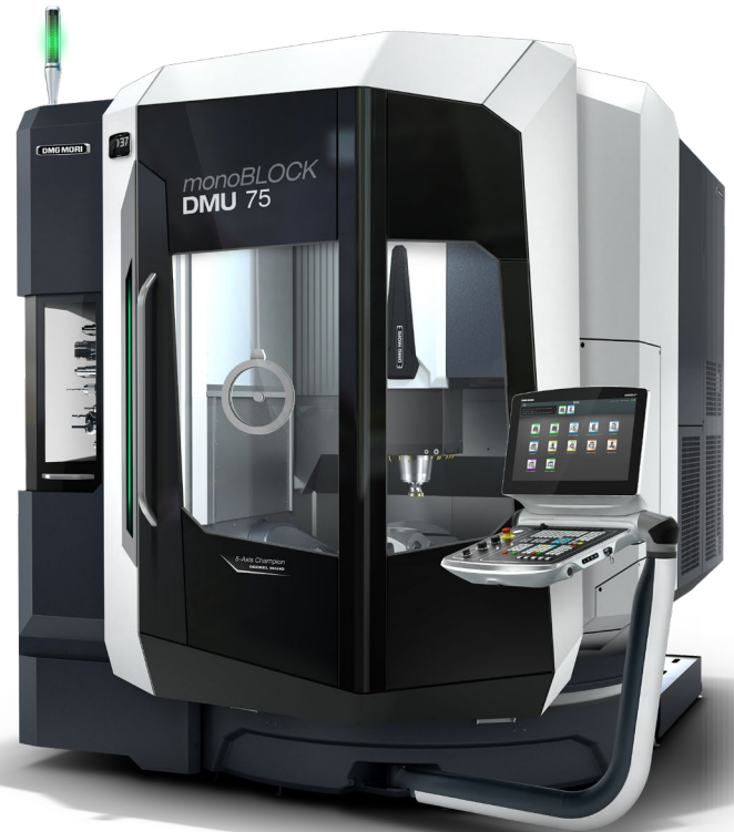
DMU 75 monoBLOCK 2 nd Gen. – höchste Produktivität, u. a. durch Technologieintegration. So sind bis zu 5 integrierte Prozesse auf einer Maschine möglich.

DMU 65/75 monoBLOCK 2 nd Gen. – Hochgenau, temperaturstabil und produktiv: Die kompakten und einfach automatisierbaren DMU 65 und 75 monoBLOCK der zweiten Generation vereinen die Erfahrung aus über 6.000 gelieferten Maschinen der monoBLOCK Baureihe mit 30% höherer volumetrischer Genauigkeit, 20% besserer Temperaturstabilität und höchster Produktivität durch Integration von Fräsen, Drehen, Schleifen, Verzahnen und Messen auf einer Maschine. Die konsequente Verbindung von Maschinen, Technologien, Anwendern, Automatisierung und Digitalisierung ermöglicht einen hohen Grad an Prozessintegration für eine ressourcenschonende und effiziente Produktion.