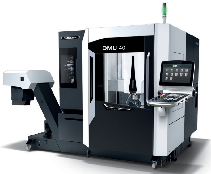
DMU 40 – universell, kompakt, leistungsstark. Der perfekte Einstieg in die 5-Achs-Simultanbearbeitung.