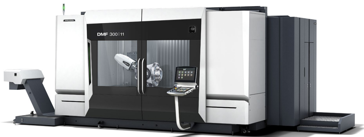
DMF 300|11 – modular aufgebaut, hochflexibel, hocheffizient. Drei Linearführungen in der X-Achse sorgen für maximale Steifigkeit und Genauigkeit.